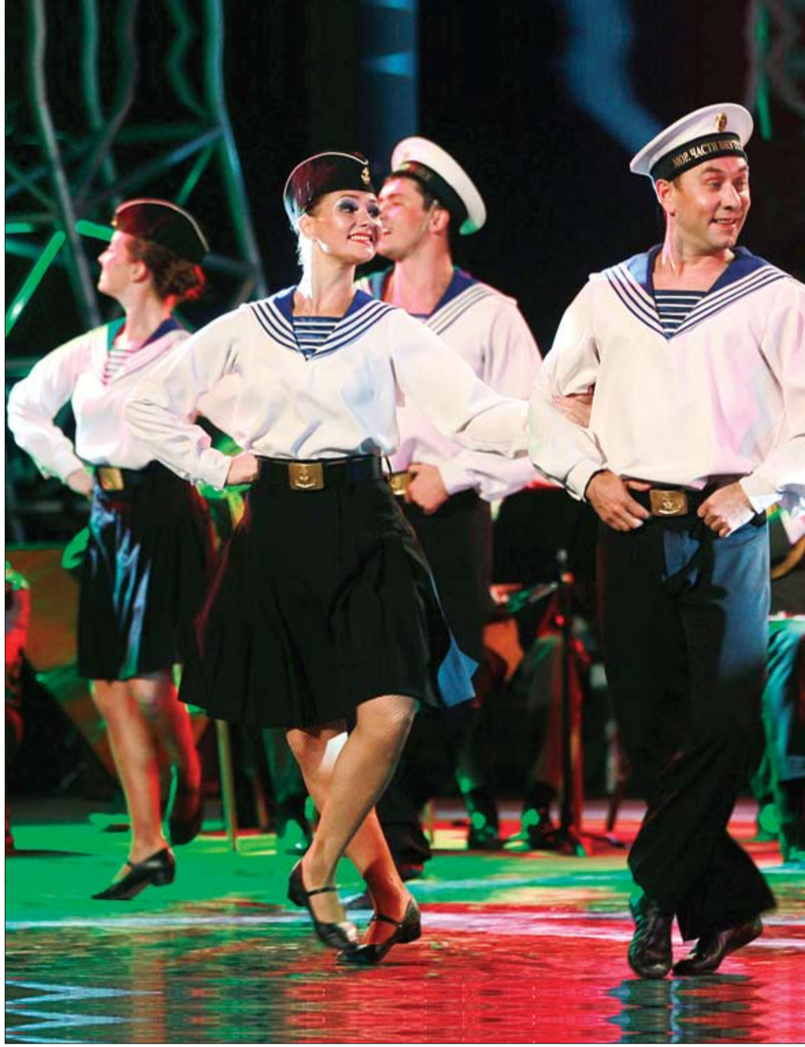
أعضاء بفرقة الجيش الأحمر الروسي تؤدي عرضاً على مسرح سيدي فرج في الجزائر.

يعاني الكثيرون من قلة النوم أو الأرق في مرحلة من مراحل حياتهم، حيث يكون التوتر والقلق هو المسبب غالباً، لكن يمكن لبعض الأمراض الأخرى أن تسببه كالاكتئاب والاضطراب والربو، وبعد أكثر شوعاً عند النساء ويزداد مع تقدم العمر . ومن الصعب إيجاد تعريف محدد للنوم الكافي للجميع، إذ تختلف الحاجة للنوم حسب نمط الحياة والعوامل البيئية ونوعية التغذية والحمية والمشروبات المتناولة. وبناء على دليل الخدمات الصحية الوطنية في بريطانيا فيما يخص الأرق، يُنصح بمراجعة الطبيب عندما يؤدي الأرق للشعور بالتعب والإرهاق، وذلك لتلقي العلاج الذي يتكون من ثلاث مراحل: المرحلة الأولى تشتمل على نصائح خاصة للمريض، مثل الذهاب للنوم في وقت محدد قدر المستطاع، وخلق الجو الهادئ والمريح الخاص بخرفة النوم، مثل إطفاء الأضواء والحفاظ على الحرارة المعتدلة. ويمكن أن تفيد التمارين الرياضية المنتظمة، مثل المشي والسباحة، وكذلك التخفيف من تناول المشروبات التي تحتوي على الكافيين، مثل القهوة والشاي بوقت متأخر من الليل. كما يُنصح بعدم الإكثار من الطعام والكحول، وخاصة بوقت متأخر بالليل وعدم التدخين. كما يفيد الحمام الساخن على الاسترخاء، وكذلك الاستماع للموسيقى الهادئة مما يمكن أن يساعد على النوم. المرحلة الثانية تكون بالحديث مع الشخص الذي يعاني من الأرق عن مشاكله ومشاعره وأسباب توتره، وذلك لمساعدته على تغيير طريقة تعامله معها ونظراته لها، حيث يمكن لهذه الطريقة بالعلاج التي تدعى بالعلاج السلوكي المعرفي أن تساعد المريض على النوم. في النهاية يتم الوصول للمرحلة الثالثة من العلاج، وهي تناول الأدوية التي تساعد على النوم بناءً على نصائح الطبيب، وذلك عندما لا تنجح كل الطرق المذكورة في التخفيف من الأرق.